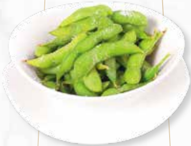
EDAMAME | € 3,50 SOJABOHNEN MIT SALZ