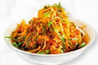
PIKANTER SALAT | € 2,90 KOHL