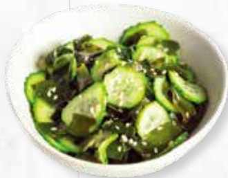
SUNOMONO | € 3,90 GURKEN