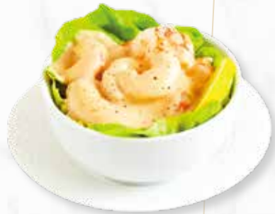
COCKTAIL SHRIMPS | € 3,90 GARNELEN, COCKTAIL SAUCE