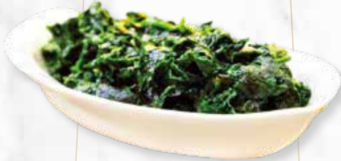
BLACK WAKAME | € 2,90 ALGENSALAT, PONZU SAUCE