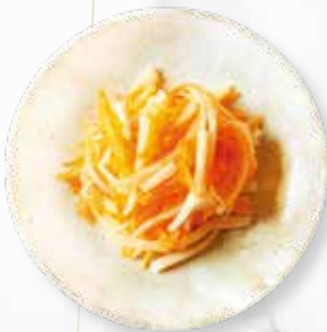
MOYASHI SALAT | € 3,90 WEISSE RÜBE