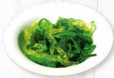
WAKAME | € 4,50 ALGENSALAT, PONZU SAUCE